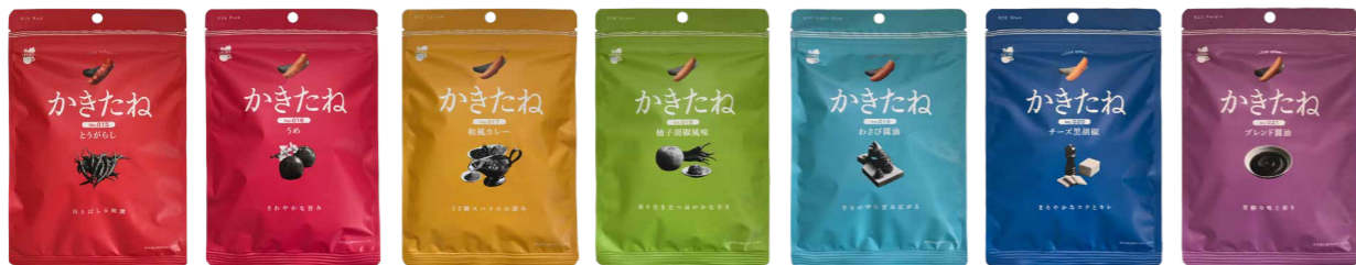
015 Red とうがらし 016 Pink うめ 017 Yellow 和風カレー 018 Green 柚子胡椒風味 019 Light blue わさび醤油 020 Blue チーズ黒胡椒 021 Purple ブレンド醤油