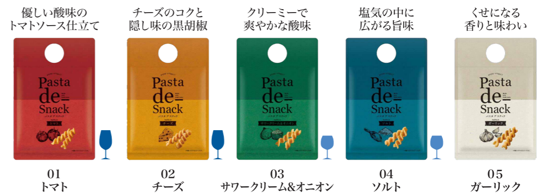
01 トマト 02 チーズ 03 サワークリーム&オニオン 04 ソルト 05 ガーリック

デュラム小麦のセモリナを使用した、食感と風味が自慢のオリジナルパスタスナック。 ワインとの相性を考慮した5種の味をご用意しました。