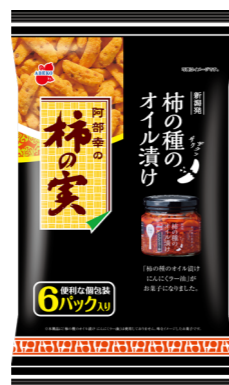
柿の実 柿の種のオイル漬けにんにくラー油風味

オーソドックスな、昔ながらの優しい塩味。カツオと昆布のダシで自然の旨みがアップしました。