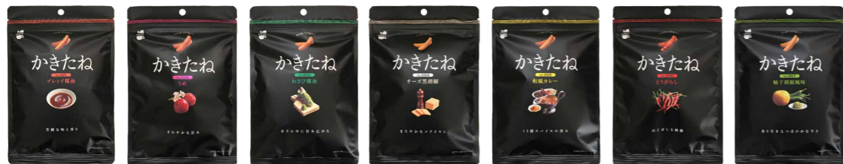
001 ブレンド醤油 002 うめ 003 わさび醤油 004 チーズ黒胡椒 005 和風カレー 006 とうがらし 007 柚子胡椒風味