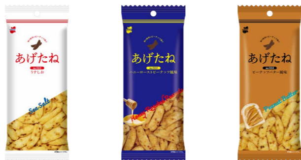
022 うすしお 023 ハニーローストピーナッツ風味 024 ピーナッツバター風味

柿の種の形をしたピーナッツ揚げせん「あげたね」。 練り込んだ「ピーナッツ」の味わいを楽しめる味展開。 かきたねの姉妹ブランドです。